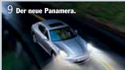
9 Der neue Panamera.