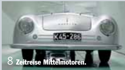
8 Zeitreise Mittelmotoren.