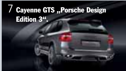
7 Cayenne GTS „Porsche Design Edition 3“.