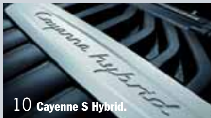
10 Cayenne S Hybrid.