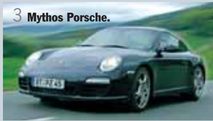
3 Mythos Porsche.